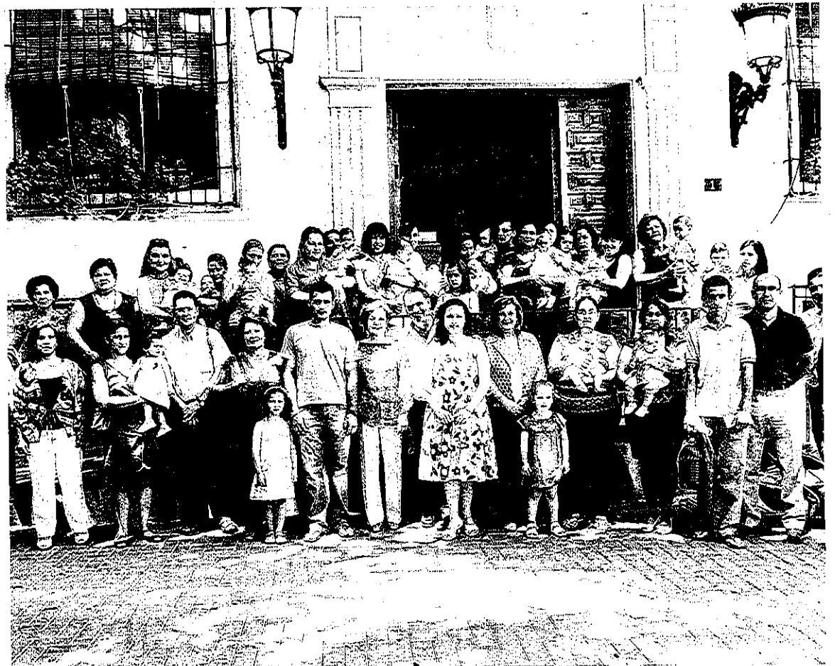
FOTO DE FAMILIA. Los padres y los hijos que han recibido las ayudas de Quesada.

Tampoco le fue mal a la única niña inscrita como Tíscar, nombre de la patrona de Quesada. Con la idea de recuperar el más quesadeño de los nombres y de combatir al singular santoral en uso moderno, la cofradía de la Virgen ha decidido subvencionar con 200 adicionales a las Tíscar. A manos de ella fue a parar esta ayuda especial para regocijo de sus padres que han defendido así la recuperación del nombre.